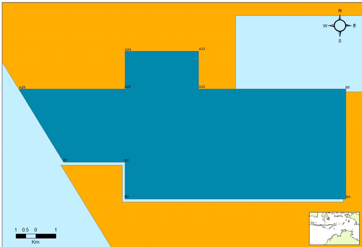
Mapa da Área do Contrato TL-SO-T 19-10